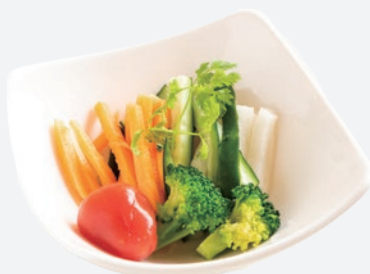
野菜のピクルス 500 (税込550)