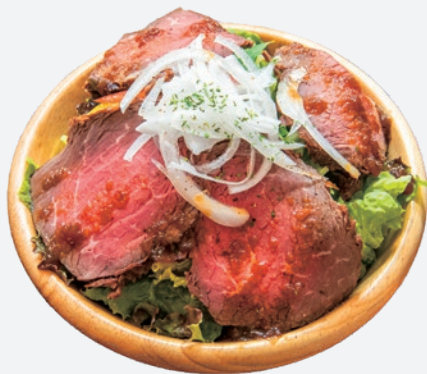
ローストビーフサラダ