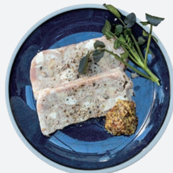
パテ・ド・カンパーニュ 600 (税込660)