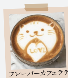
フレーバーカフェラテ