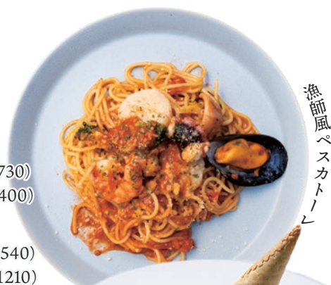
漁師風ペスカトーレ