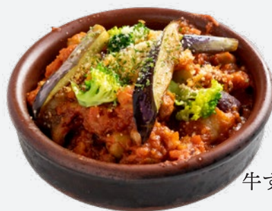
牛すじ肉のトマト煮込み 800 (税込880)