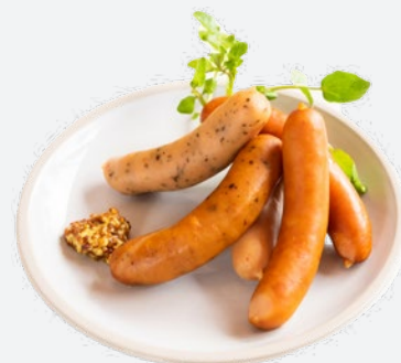
ソーセージ5種盛り 782 (税込860)