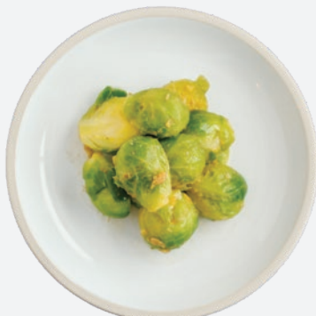
アンチョビ芽キャベツ 500 (税込550)