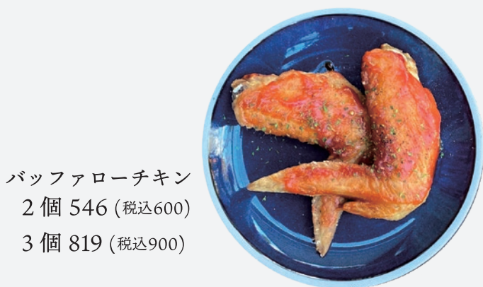
バッファローチキン 2個 546 (税込600) 3個 819 (税込900)