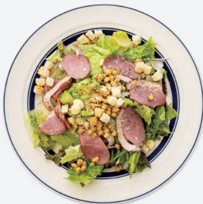
鴨肉のパワーサラダ