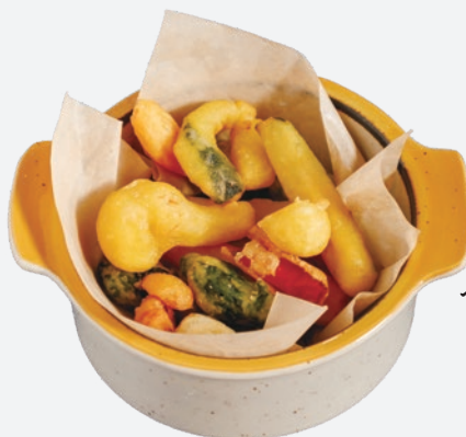
ベジタブルフリット S 582 (税込640) M 728 (税込800) L 882 (税込970)