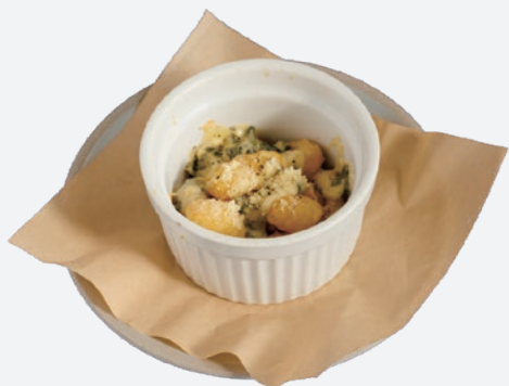
ニョッキ ~ブルーチーズかけて~ 500 (税込550)