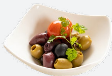
オリーブミックス 500 (税込550)