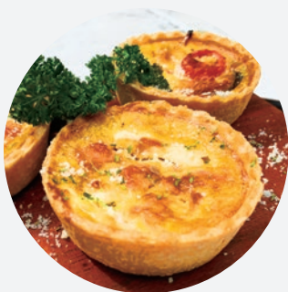
ミニキッシュ 1個 346 (税込380) 3個 1000 (税込1100)